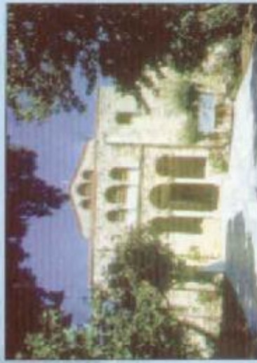
17 ΑΙΩΝΟΣ ΕΚΑΤΟΝΤΑΥΓΙΑ ΝΗΣΟΣ ΠΑΡΟΥ (326 - 1997)